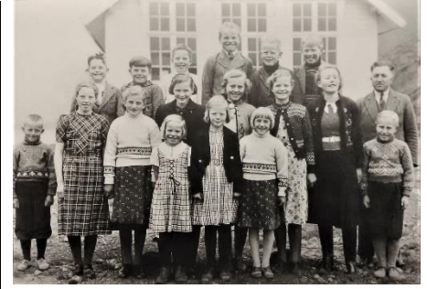
Elever på Espeland skule 1939. Navn; se Bjerkreimboka IV side 2464.