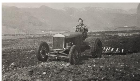
Mekanisering. Ivar P. Espeland horver med heimelaget traktor 1947. Ivar var bare 17 år da han bygde sin egen traktor av deler han kjøpte hos en bilopphogger i Stavanger. Fremste delen av traktoren var fra en T-Ford, girkassen kom fra en A-Ford og kardangen fra en Chevrolet lastebil. Bokhjula var lastebil hjul med kjettinger. Ivar Brukte traktoren på garden i om lag 8 år uten problem av noe slag, og det var en god traktor.