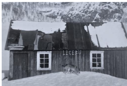
Dette er Legebu, hytta til Håkon Espeland, på heia ovenfor Espelandsfossen. Var fint å gå tur fra Malmei til denne hytta, både sommer og vinter. Bildet er vel fra 1970-talet.