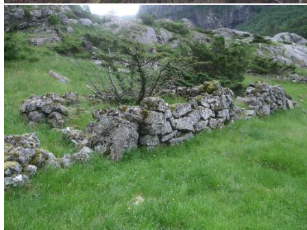
Husmannsplassen Fossbrekka, med hus-grunnen i 2017.