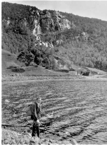
I bakgrunnen Espelandsfossen med gamle kvernhus og, saghus nede ved vejen.

Espeland med gamle kvernhus, saghus og vassrenne fra Kvednabekkjen under Espelandsfossen. I saghuset bak var det sirkelsag og maskiner for å lage treskobotner. Velle Espeland f. 1864 var med å bygge denne «fabrikken». Han flytte til Hovsherad og starta produksjonen der og der produserer de den slags enda.